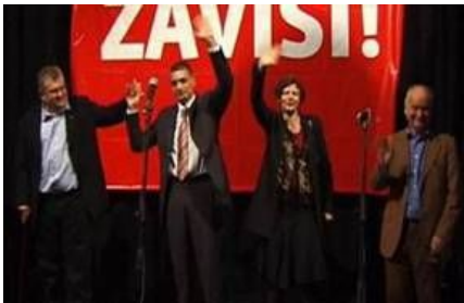
Politický prírastok Rothschildovcov

agentúry pobočkami AP (Associated Press) a Reuters, ktorú Rothschildovci vlastnia už od 19. storočia. Soros rovnako infiltroval kultúrne a vzdelávanie inštitúcie, divadlá, Národnú knižnicu, Historické archívy a SANU (Srbskú akadémiu umenia a vied). Po svojom boku zhromaždil rozsiahlu skupinu hercov, režisérov, dramatikov, hudobníkov, spisovateľov, vedcov, analytikov a bývalých diplomatov, ktorí mu asistujú pri získavaní viac a viac nasledovníkov.