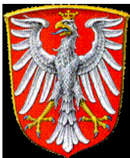
Erb mesta Frankfurt

Za účelom lepšieho oboznámenia sa s novým panovníkom a jeho vojvodami, pozrieme sa na rodokmeň a chronológiu tejto dynastie. Celý príbeh začína na konci osemnásteho storočia Amshelom (alebo Mosesom Bauerom) Rothschildom.