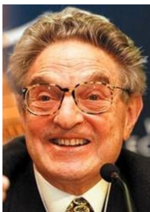
George (Schwartz) Soros, hlavný agent Rothschildovcov

Soros je maďarský Žid (Chazar), narodený v Budapešti v roku 1930 ako György Schwartz (v roku 1936 si jeho rodičia zmenili meno na Sorosz). Vzdelanie dostal v Londýne a v roku 1950 odišiel do USA. Významnú úlohu v jeho živote zohral slávny Chazar Carl Popper, ktorý schvaľoval Sorosove projekty a bol jeho Guru.